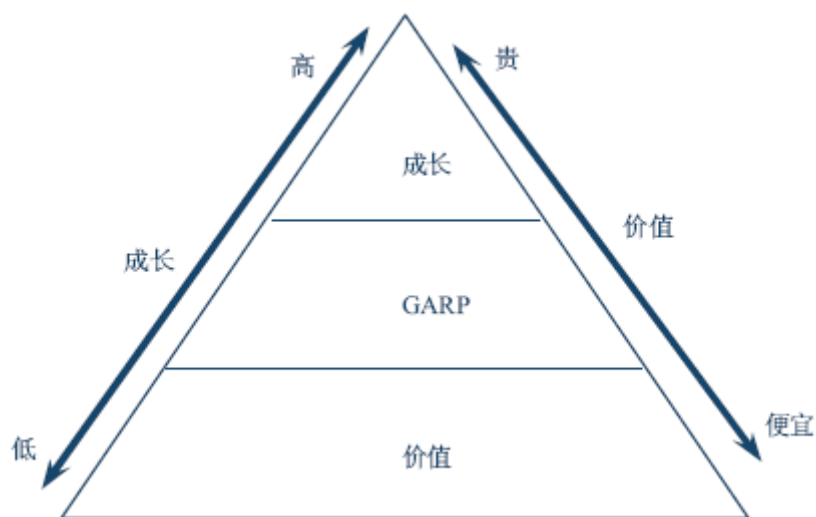
图 1 GARP 投资理念

② 对价值型公司的成长属性进行分析，可以发现相对投资价值较具成长性的股票，在成长潜力释放的过程中获得收益，规避市场价格未合理反映其成长性不足的股票。